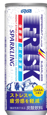
FRISK Official Licensee © 2024 Perfetti Van Melle.