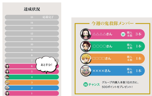
<購入本数確認画面>