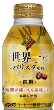
△「ダイドーブレンド 世界一のバリスタ監修〈微糖〉」（イメージ）

※世界一のバリスタ：ワールドバリスタチャンピオンシップ 第14代チャンピオン ピート・リカータ氏