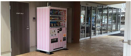
紙おむつ自動販売機を設置